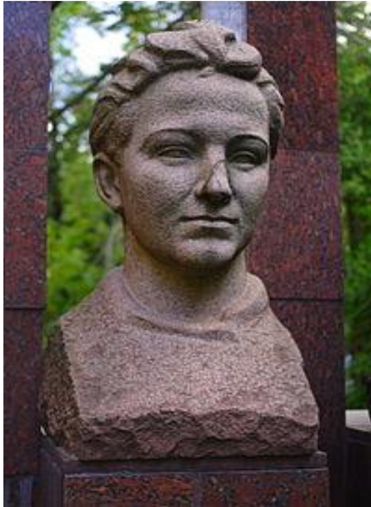
Памятник возле московской школы № 201